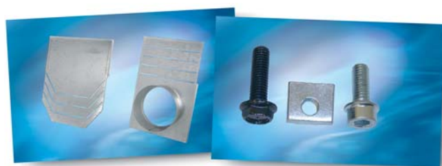
Stirn- bzw. Endplatten verzinkt oder Edelstahl