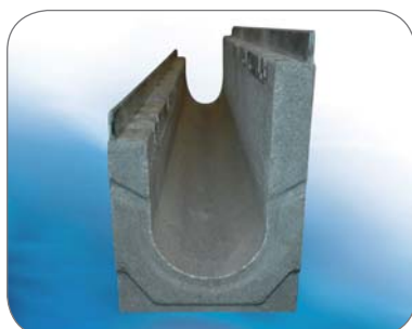
Ansicht stirnseitig - Rinne mit unterschiedlichen Wandhöhen

Die BGU-Z Fassadenrinne kann mit den Abdeckungen und den Zubehörteilen der BGU-Z Universalrinne SV kombiniert werden.